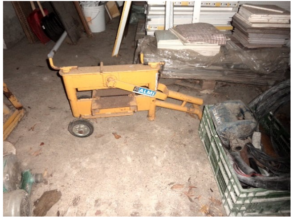
Slika broj 4-8 -Inventarni broj 144