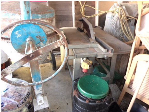
Slika broj 4-11 -Inventarni broj 391