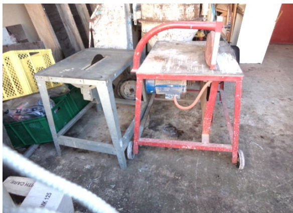
Slika broj 4-5 -Inventarni broj 103 i 346