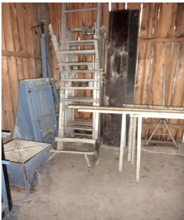
Slika broj 4-9 -Inventarni broj 282