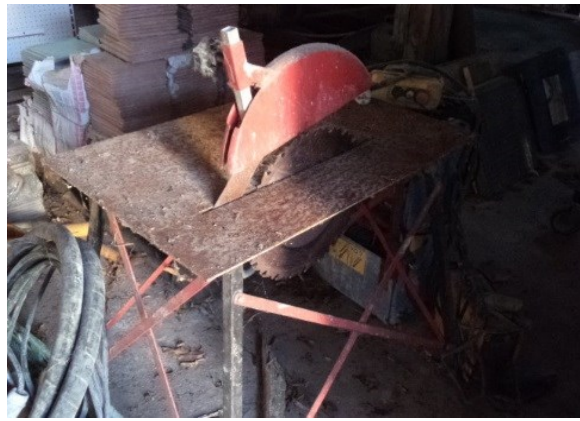
Slika broj 4-2 -Inventarni broj 242