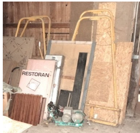
Slika broj 4-4 -Inventarni broj 25