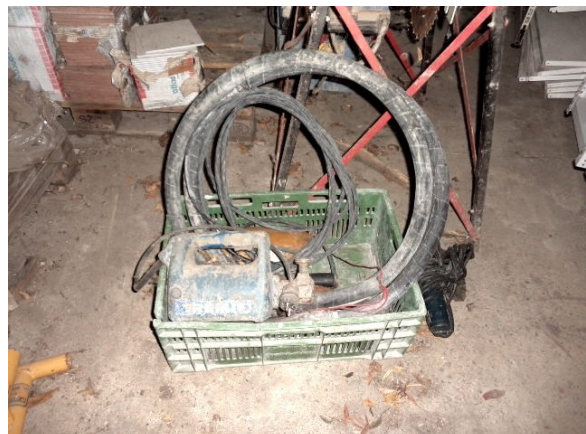
Slika broj 4-12 -Inventarni broj 242