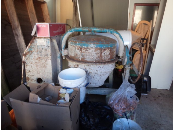
Slika broj 4-7 -Inventarni broj 108