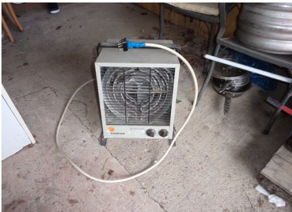
Slika broj 4-3 -Inventarni broj 214