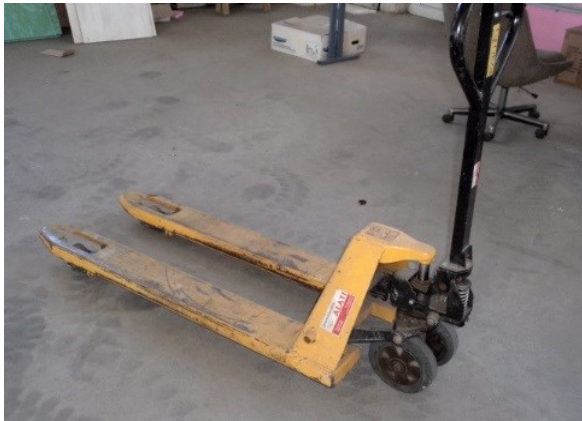
Slika broj 4-1 -Inventarni broj 140