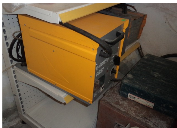
Slika broj 4-6 -Inventarni broj 105